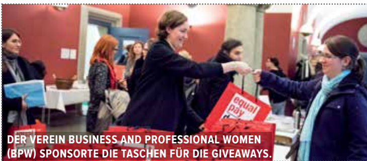
DER VEREIN BUSINESS AND PROFESSIONAL WOMEN (BPW) SPONSORTE DIE TASCHEN FÜR DIE GIVEAWAYS.