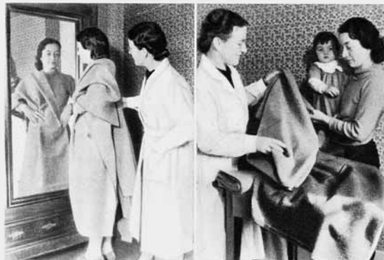
Der Stoff zu einem Mantel wird ausgemacht. Die Leiterin der Nähstube ist bei der Wahl in freundlicher Weise behilflich.