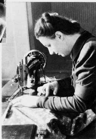
Eine Auslandschweizerin, Flüchtling aus Polen, näht in der Nähstube für Wehrmannsfrauen ein Kleid für ihre Tochter.